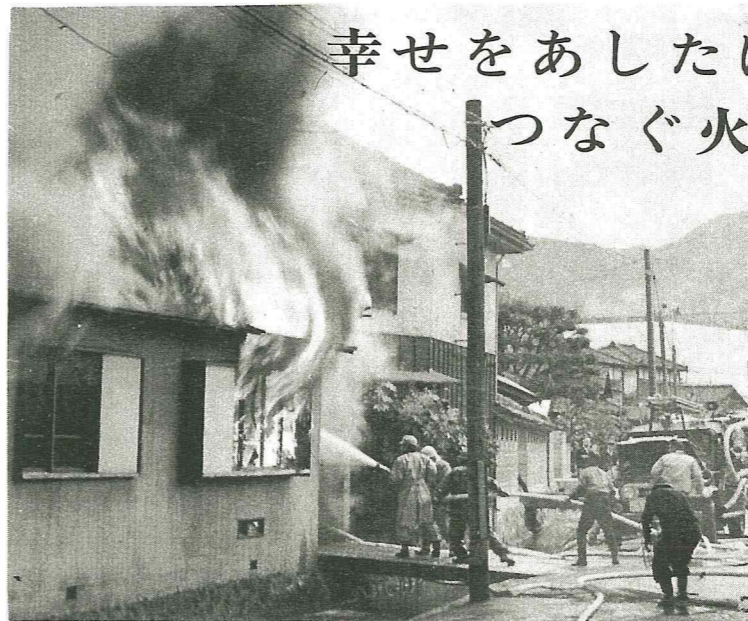
幸せをあしたに つなぐ火の始末