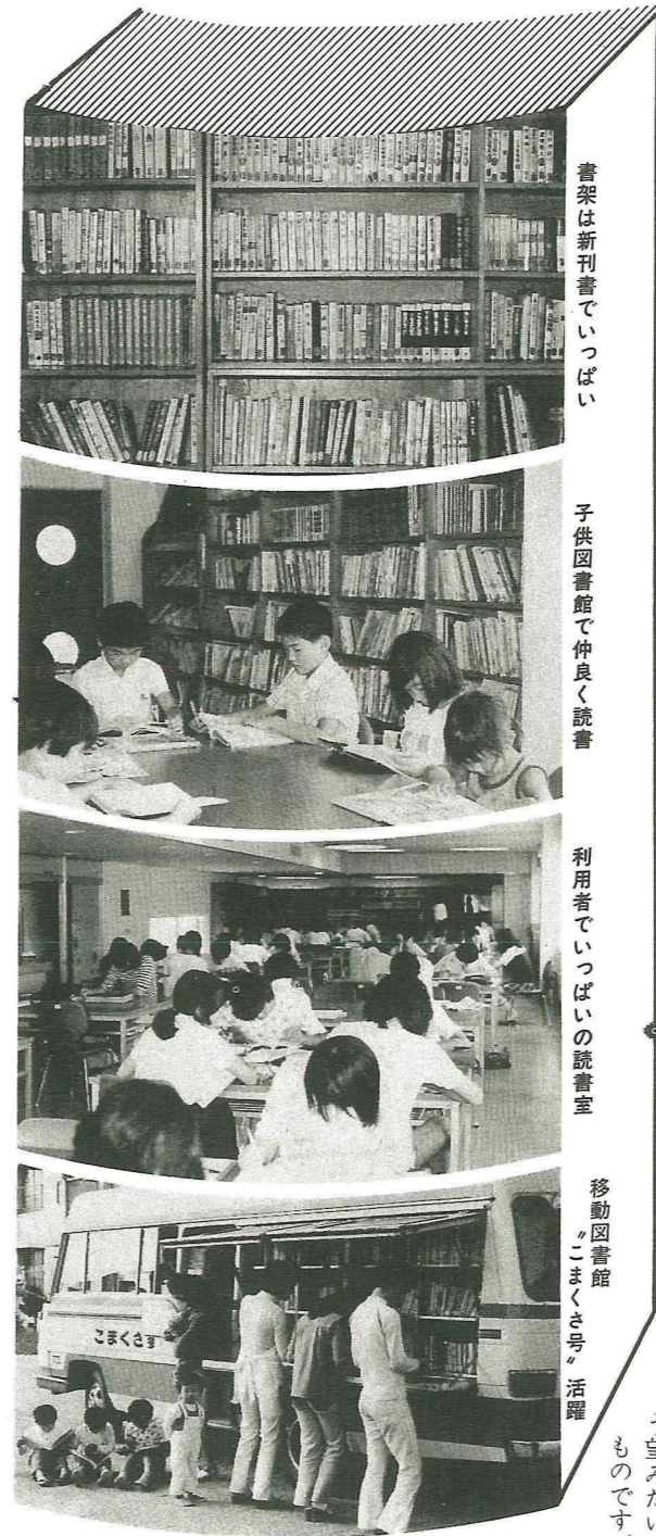
書架は新刊書でいっぱい