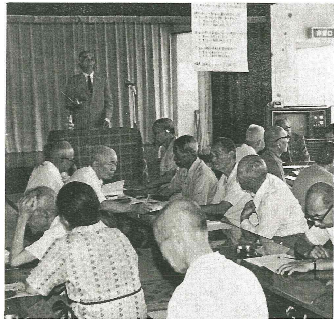
若い人達に負けないように………高齢者大学開講