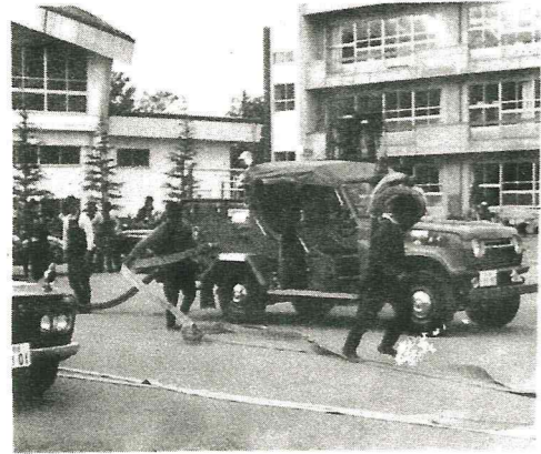
白石消防団に機動力導入