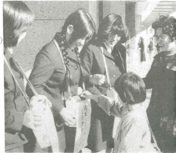
白女高JRCによる街頭募金

歳末たすけあい運動は、十月一日から十二月三十一日までの三カ月間にわたって行われる共同募金運動の一環として、特に十二月を重点的な運動月として行われております。この運動の目的は「みんなそろって明るいお正月を迎える」ことが狙いであり、市民の自発的な意志にもとづく地域のたすけあい運動として実施されていきます。十二月の運動月を前に、社会福祉法人、中央共同募金会長より白石共同募金会に対して、「多年にわたる国民たすけあい共同募金運動に努力した」ことにより表彰を受けました。これは白石共同募金会のみでなく、市民の皆さまのご協力の賜と深く感謝しております。これから歳末たすけあい運動によって集められた善意の浄財は、恵まれない人々に越年資金やお年玉、お見舞として送られます。明るく楽しいお正月をみんなそろって迎えられるよう、より一層のご協力をお願いいたします。