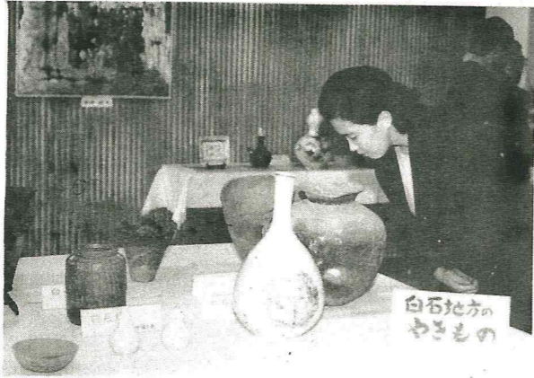
白石地方のやきもの

11月20日より25日まで市図書館において、東北各地より珍しい焼物60数点を一堂に集め展示された中で、特に白石地方の縄文時代の焼物が目につきました。