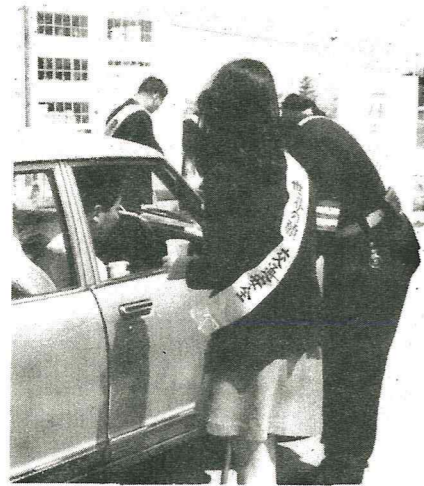
コーヒーをどうぞ