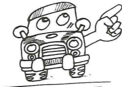
さわやかな秋を 無事故で