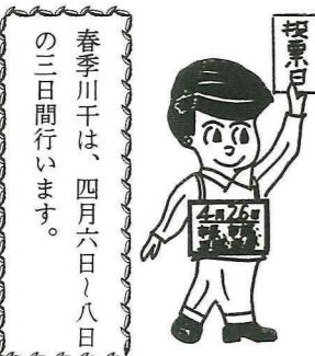
戦後初の総選挙(昭和21年)

ライドその他の方法による映写等。 二十七、演説会場で使用する立札、看板等を運搬中、故意に回覧すること。 二十八、著述演説等の広告その他の名義をもってする文書図画の頒布または掲示。 二十九、見舞状、その他これに類似するあいさつ状の選挙区内への頒布または掲示。 三十、選挙運動用通常葉書を郵便によらず通行人に頒布すること。 三十一、選挙運動用通常葉書の他人への譲渡。 三十二、選挙期日後における自筆の信書および答札の信書以外の文書図画の頒布または掲示。 以上が禁止されている選挙運動です。その他の方法で行う選挙運動にも種々制限がありますので注意が必要です。 尚、詳しいことは、選挙管理委員会にお問い合わせください。