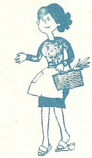
サラリーマンの奥さん

20歳以上で、厚生年金などの職場の年金に加入している人の奥さんや、国の年金制度から障害年金や遺族年金を受けている人や、昼間の大学生などは本人の希望で加入することができます。