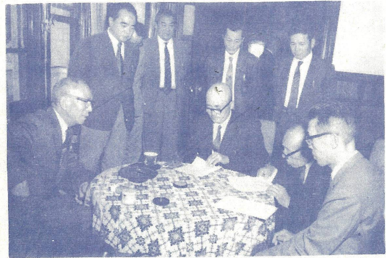
候補を予定されている人は必ず出席し説明をうけてください。

白石市農業委員会委員の選挙を7月14日(金)におこないます。 農業委員会委員の任期は7月19日をもって満了となります。 その一般選挙を次によりおこないます。 選挙期日 七月十四日(金) 選挙期日の告示 七月四日(火) 選挙すべき委員の数 十四人 ◎ 立候補予定者説明会 六月三十日市民会館第二集会室 この選挙に立候補される人のために六月三十日午後一時半から市民会館第二集会室で説明会を開きます。また立候補届出書等諸届出用紙も交付しますから立