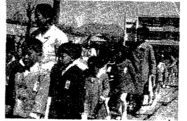
○国民年金手帳や国民年金証書を紛失したり、破ったときは、再交付申請書を提出してください。 ○国民年金のことで問い合せは市役所市民課、各出張所、分室へ。 交通安全：この子たちを大事に（昨年の入学児）

四月からは、かわい子供さんたちが小学校へ入学し、大きなランドセルを背負って通学します。胸をふくらませ、希望と喜びに輝くこの子供さんを傷つけないように、皆さんで交通事故防止に特に注意してください。 交通事故は四十五年度も全国民の期待に反し史上最大の記録となりました。 四月からは、かわい子供さんたちが小学校へ入学し、大きなランドセルを背負って通学します。胸をふくらませ、希望と喜びに輝くこの子供さんを傷つけないように、皆さんで交通事故防止に特に注意してください。 交通事故は四十五年度も全国民の期待に反し史上最大の記録となりました。