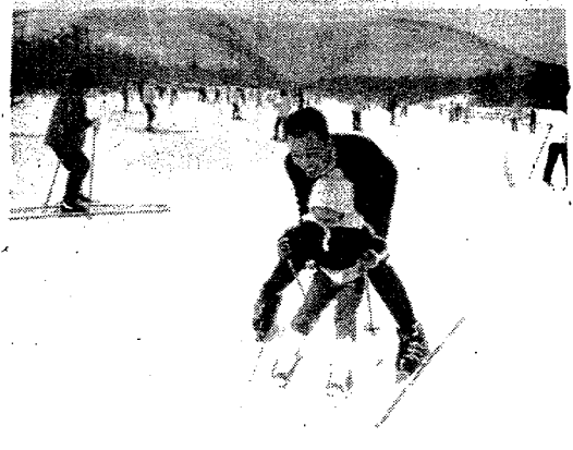
▲家族づれでにぎわう南蔵王白石スキー場

少年、成年、壮年、女子 の四部にわかれ、回転競技 と大回転競技のスキー競技 大会を白石市体育協会主催 で開きます。みなさんの応 援と観覧を期待します。 ○会場 国設南蔵王白石ス キー場 ○日程 十三日(土)午前 十一時開会、午後一時か らAコースで大回転競技 で開きます。みなさんの応 援と観覧を期待します。 ○会場 国設南蔵王白石ス キー場 ○日程 十三日(土)午前 十一時開会、午後一時か らAコースで大回転競技 で開きます。みなさんの応 援と観覧を期待します。 ○会場 国設南蔵王白石ス キー場 ○日程 十三日(土)午前 十一時開会、午後一時か らAコースで大回転競技 で開きます。みなさんの応 援と観覧を期待します。