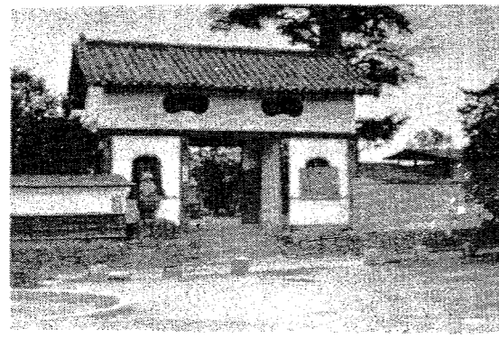
▲写真.....延命寺山門の旧白石城厩口門

れた場合を除き、銃の使用はできません。早目に安全な場所に厳重に保管してください。 ▽銃の点検は、銃口を安全な方向に向け、実弾が入っていないかどうかをよく確かめ、安全なところで行なうこと。 ▽銃と火薬類は、別々に保管する。火薬類は発火または燃えやすいものの近くに