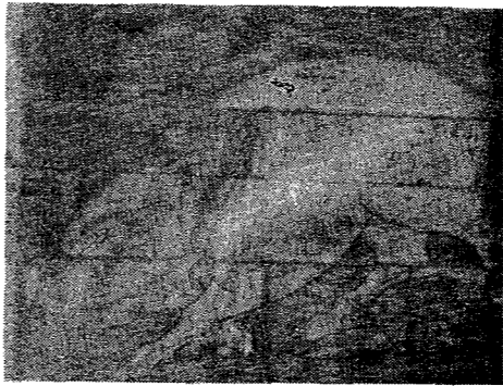
▲白のしし絵馬(白石神明社蔵)

毎年二月一日現在でこの場合でも調査日前の過去一カ年間の農産物総販売額が五万円以上ある世帯について調査します。 市内に百二十二の調査区を設け、調査員が各調査区を訪問、きまどり調査をしますからよろしくご協力ください。 調査項目は、世帯員、専業兼業別区分、耕地、農業機械、農業雇用労働、家畜農作物の作付等が主な調査事項です。