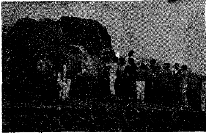
〈写真〉……標高1650mの「不忘の碑」に花束を捧げ、福を祈る

太平洋戦争中、昭和二十三年三月十日の吹雪の夜、日本に襲来したアメリカ空軍のB29三機が不忘山の頂上付近に相次いで激突。その乗組員三十四名全員が死亡しました。後年、白石市の有志が発起人となり全国から集まった浄財でアメリカ将兵の霊を慰め、人類の永遠の平和を願う「不忘の碑」を建立しました。 九月二十三日はその十年に当り、不忘の碑建立委員が発起人となり、秋深い不忘山麓の高原で追悼の集いを催し、有志の人々が不忘山頂を訪れ、花束を捧げて冥福を祈り、あらためて戦争のない平和な生活を誓い合いました。