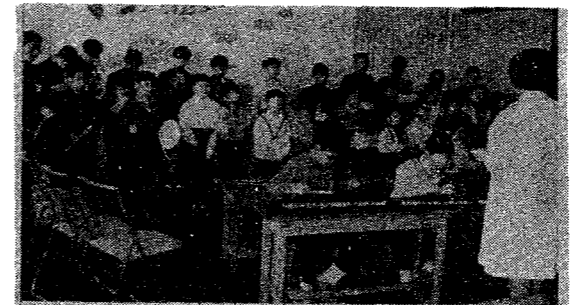
〈写真〉...苦しいけれどがんばるぞ=ベッドスクール

加入者ホーム運動会では飛入り愛嬌まく アメリカとカナダの国際ロータリークラブからロータリー一行七名が九月十四日から十六日まで白石市を訪問しました。ロータリークラブは、各人の職業をとおして自分みなが、会員同志でたすけあつて社会に奉仕し、また国際間の親善をはかる目的の団体です。一行はR・T・ローズさんを中心として、日本各地の行政機構や経済、社会福祉など、市役所や工場を視察したり、市内の工場を視察したり、十五日の敬老会には郵便加入者ホームをたずね、ちょうど開かれていた運動会ではビン釣り競争に参加。十六日には市役所で市長と会い、地方自治問題について約三十分の熱心な話し合い、戦時中について話したB29の塔乗員のめい福を祈る「不忘の碑」について「手厚い取扱いをう