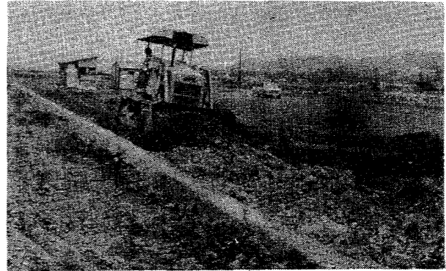
写真.....工事中の白南地区圃場整備現場

幸いに、この事業は県営圃場整備事業として施行されることになり、白石川の北側、福岡地区を白北地区とし、大平・斎川地区を白北地区の二つにわけて実施されます。