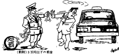
(罰則) 5万円以下の罰金

から今後絶対に酒酔い運転による交通事故を起さないように、お互いに注意しましょう。