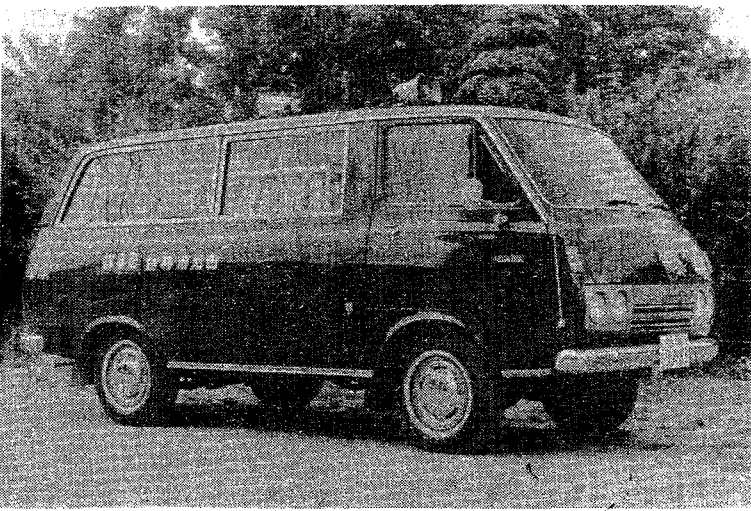
写真……(移動図書館車)