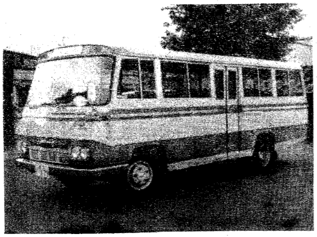
写真.....新しい患者輸送車

歳末たすけあい運動は、地域住民の自発的な運動として始まり、年々活発な運動が全国的に展開されております。 最近の経済事情の変わりによる所得格差や地域格差がますます拡大し、出稼ぎ家庭の増加など都市、農村を問わず私たちの身のまわりには大きな変化が起っております。 社会的、経済的發展にとり、生活水準は向上してきておりますが、一方ではその発展から取りこぼされた多くの人がおります。 この人々をたすけあい、みんなそろって明るい正月を迎えられるよう、あなたかのおもいやりと、たすけあいの運動を展開いたしまし、市民のみならず、ご協力をお願いいたします。