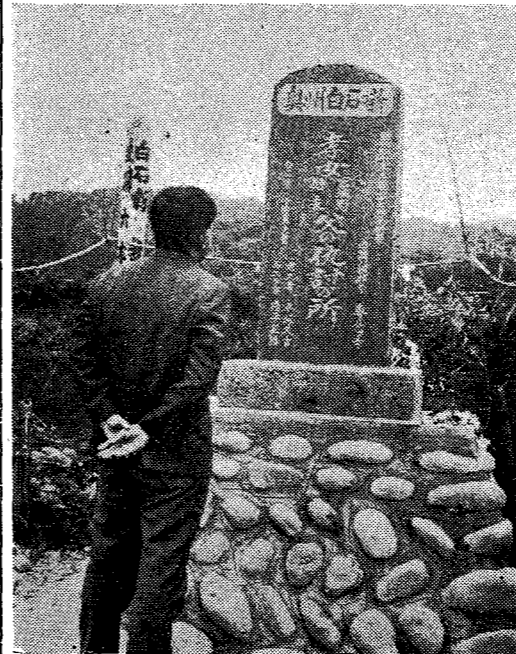
あだ討ちの碑 このほど奥州白石断で有名な宮城野、信夫の姉妹が父のあだ討ちを果たした、といわれる市六本松川原にあだ討ちの碑が建てられました。

訓練生を募集 肉体的、精神的に、一年間の訓練にたえうるものただし団体生活の困難なものの障害が重度で修了後の就職が困難とみとめられるものに現に症状が固定してないもの及び伝染性疾患者は入所を許可しません。学歴は義務教育修了者であること。