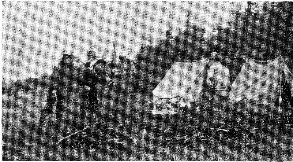
(写真……花畑附近のキャンプ地)