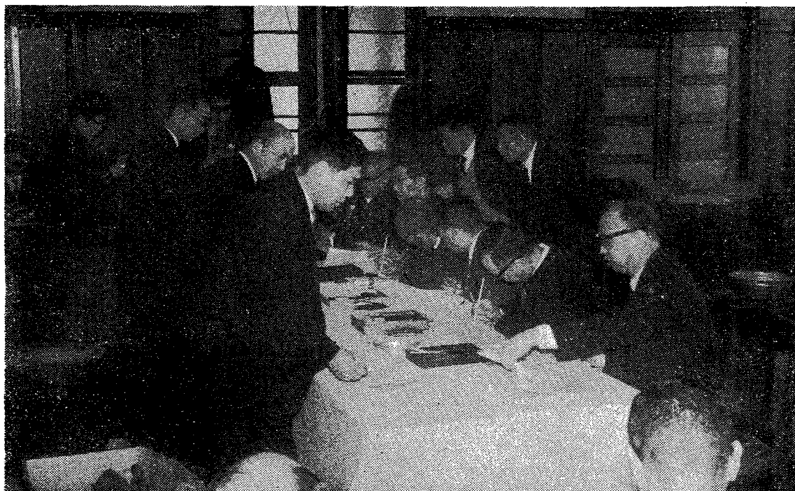
(契約書に仮調印する組合長さんたち)