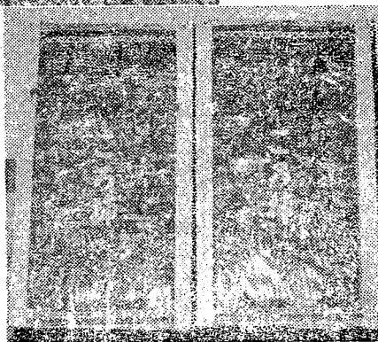
【写真】 正月用として各地に出荷されている白石名産ころ柿