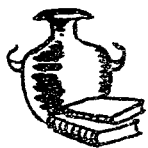
(白石警察署 防犯少年課)

「明るいオラが まちな年末年始」 をむかえるようお たがい頑張りた いとおもいます。 みなさん、明る い一九六四年をお むかえくださいま すように。