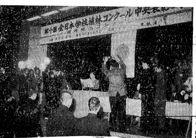
(写真……農林省に於ける植林コンクール表彰式)

これは単なる思い付きや 器用さだけではない。科学 的調査と統計資料を とらへ、一言御祝辞を申し つけます。