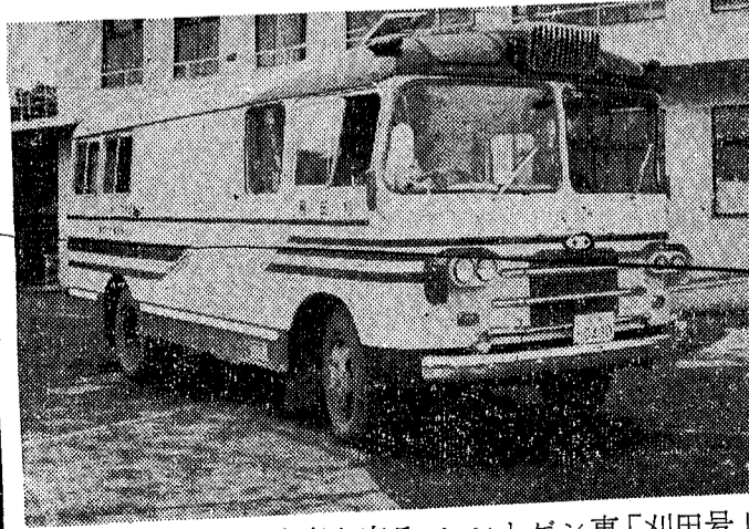
(写真……市民の健康を守る。レントゲン車「刈田号」)