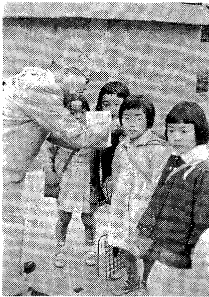
【写真】黄色い羽根をつけ正しい交通