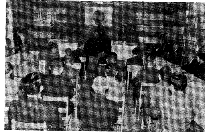
【写真—市教委より表彰をうける受表彰者】