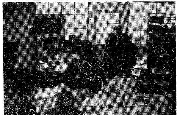
【写真—読書に親しむ児童たち 図書館にて】