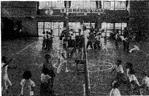
【写真=バレーボール大会】