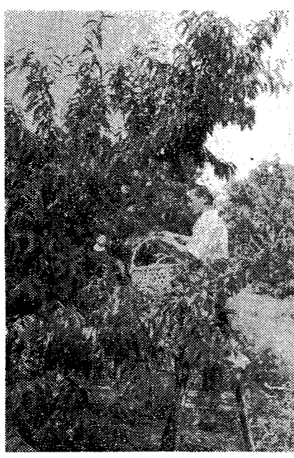
【写真=最盛期に入った 大熊部落のモモ(樹令6年生)】

主穀農業経営に果樹経営 われていきます。 とくに昭和35年には市農 林課の指導にもとづいて新 農村建設事業として果樹園 共同防除施設を総工費、92 万6千円、国庫補助46万4 千円、公庫融資40万円で実 施しその規模は配管3千2 合員が50 名(内大 熊地区は 9名)です。