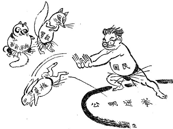
三悪を土俵の外へ

背景に、来るべき総選挙における公明選挙運動の中心を「選挙法を守る運動」として全国的に展開することになり、また市内有権者のみなさまぜひこの運動にご協力下さつて明らかな選挙をいたしましょう!