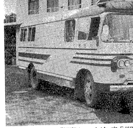
【写真はレントゲン車「刈田号」】