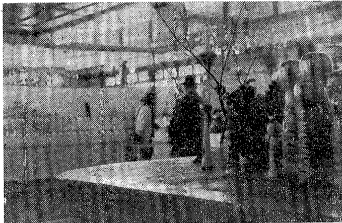
【第二回全日本コケシコンクール会場風景】