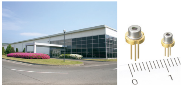
▲自然豊かで美しい花に囲まれる社屋 ▲主力製品の半導体レーザー

ソニーセミコンダクタ株式会社は、最先端の半導体製品を開発・製造し、ソニーのエレクトロニクスビジネスを強力にドライブしている半導体メーカーです。白石蔵王TEC（テクノロジーセンター）は、レーザー光を出射する光半導体、半導体レーザーを一貫で開発・製造するグループ内唯一の事業所。製造される製品は、CD・DVD・Blu-rayなどの製品やゲーム機、レーザープリンタなどに搭載され、世界中の人たちに愛用されています。また、同TECでは地域貢献活動にも力を入れ、特に小中学校を訪問しての「ものづくり教室」は開催回数90回を超える人気講座で、子どもたちの科学への好奇心を育てるのに一役買っています。