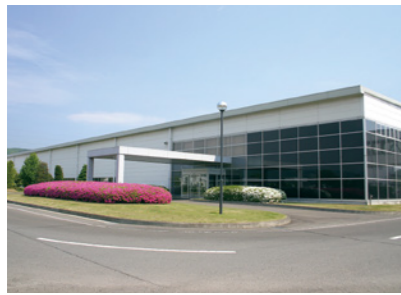
▲自然豊かで美しい花に囲まれる社屋