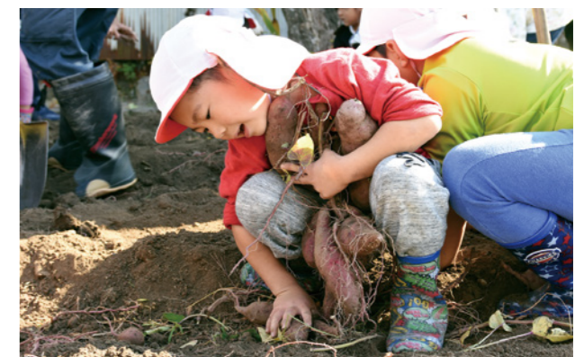
▲夢中で芋掘りをする園児。両手いっぱいのサツマイモを収穫しました

10月30日、第一幼稚園の園児たちが同園内の畑でサツマイモ掘りを行いました。同園では、園児たちに人とかかわることの大切さと食の大切さを学んでもらおうと一昨年から実施。本郷第三自治会・亘理町自治会ボランティア9人の協力のもと、5歳児31人がサツマイモ掘りにチャレンジしました。園児たちは「あったー！」「おっきいおイモもちっちゃんおイモもあった！」と歓声を上げながら元気いっぱいサツマイモ掘りをしていました。11月11日には焼きイモ会を行い、自分たちで育てたサツマイモの味を堪能しました。