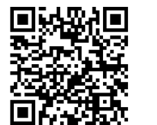
ライブ中継 → QRコード

●日時 12月4日(金)10:00開会予定 ●場所 市庁舎5階議場 ◎議会事務局 ☎22-1351