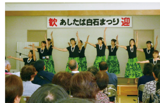
▲「初めてのフラダンス」講座受講生が踊りを披露しました

10月18日、あしたば白石で第41回あしたば白石まつりが開催されました。この催しは、同施設を拠点に活動しているサークルや講座受講生たちの発表の場として年に一度、実行委員会の主催で開催。会場には写真や絵画、ちぎり絵など自慢の作品が展示され、訪れた来場者は展示品に見入ったり質問したり、和やかな雰囲気となりました。舞台ではフラダンスや太極拳、ギターなどの団体が日ごろの練習の成果を披露しました。あしたば白石のサークルや講座を通して練習を積み重ねてきた皆さんからは、大きな元気を感じることができました。