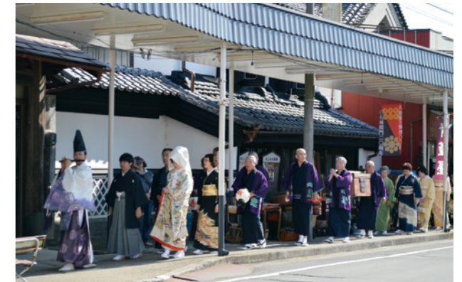
▲古式ゆかしい和装の花嫁行列

10月16～18日の3日間、「第12回白石城下きものまつり」が壽丸屋敷とすまいるひろばで開催されました。壽丸屋敷ではアンティーク着物や古布をつかった作品の展示販売やその場で着物をレンタルできる華麗なる変身館などを開催。すまいる広場では、着物ファッションショーやテントきもの市、着物着付けショー、市内のカップルによる古式ゆかしい和装の花嫁行列などが行われました。訪れた人たちは、色とりどりのお気に入りの着物に身を包み、着物を通して世代を超えたコミュニケーションを楽しんでいました。