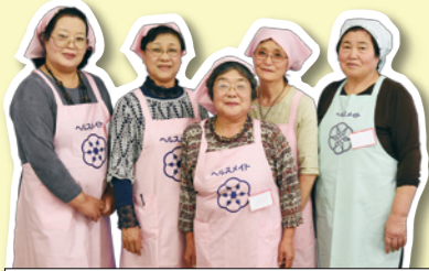
斎川地区の皆さん