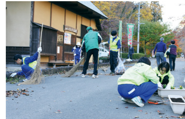
▲材木岩公園内を清掃する小原中学校の生徒たち

11月4日、小原中学校の生徒が材木岩公園内の清掃活動を行いました。この活動は、生徒たちのふるさとを大切に心や奉仕の心を育もうと10年以上前から実施しており、1年間で材木岩公園、スパッシュランドパーク、小原公民館を清掃しています。この日は同中の生徒14人などが参加。4グループに分かれて検断屋敷内の清掃やフラワーポットの設置などを行いました。参加した生徒は「観光客の皆さんがきれいになった材木岩公園を見て喜んでくれたらうれしいです。もっとたくさんの人に小原の良さを知ってほしい」と笑顔で話してくれました。