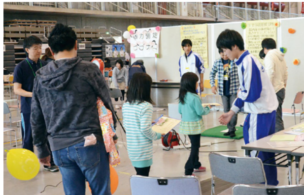
▲さまざまな年代が体力測定に挑戦！

11月1日、「第7回白石市健康福祉まつり」をホワイトキューブで開催しました。「こころから健康」「障がいのあるを超えた共存社会」の実現を目指して開催しているこの催し。体力測定や各種健診をはじめ、健康料理の試食、心を豊かに保つためのリラックス方法紹介、福祉団体によるステージ発表、車いす・目かくし歩行・手話体験など多彩なコーナーが設けられ、約1,700人の来場者でにぎわいました。会場には中高生や大学生のボランティアも参加し、さまざまな団体や世代が集まって交流を深め、健康や福祉を見つめるイベントとなりました。