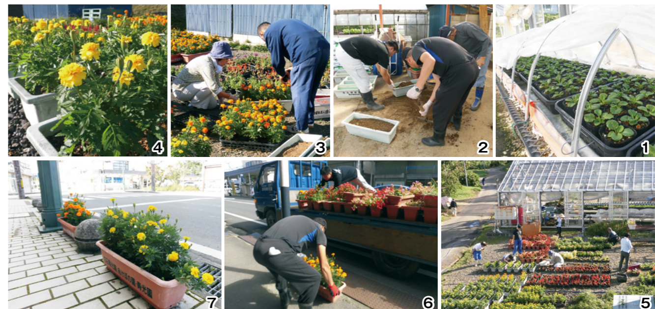
1_苗は大きくなるまでハウスの中で育てます 2_腐葉土などを混ぜ合わせた土をプランターに詰めます 3_苗をプランターに移し替えます 4_きれいに移植されたマリーゴールド 5_利用者、職員が力を合わせ作業しています 6_まちなかにプランターを設置 7_駅前通りに設置されたマリーゴールド。観光客だけでなく、まちなかの人のおもてなしもしています

種まきから設置まで、長い時間をかけ一つひとつ丁寧に愛情込めて育てられた白石陽光園のプランター。花があると雰囲気が華やかになりますよね。市街地にお出掛けの際は、素敵に咲いているプランターの花をぜひご覧ください。