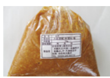
▲好評の「手作り味噌」

※白石市農産物直売所連絡協議会加盟店のみ掲載しています。「SSN」は「白石・新鮮・農産物」の略称です。