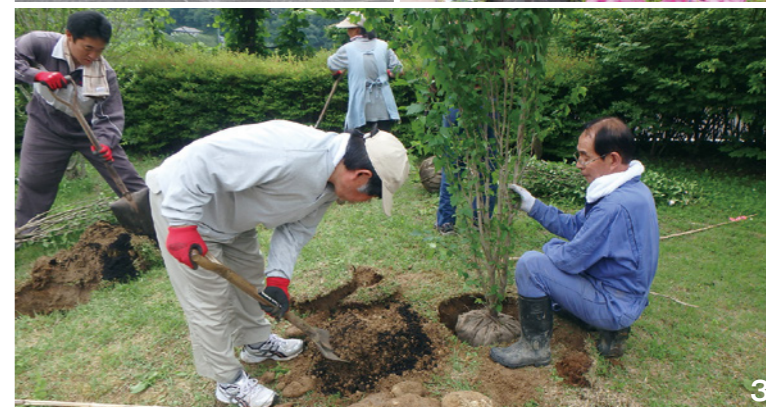
1_検断屋敷前で色鮮やかに咲いているサフィニアマックス 2・3_同協議会メンバーと地域のボランティアが、スパッシュランドパークにムクゲなどの苗木を植栽。参加者は「花木が成長し、花が咲くのが楽しみです」と話していました