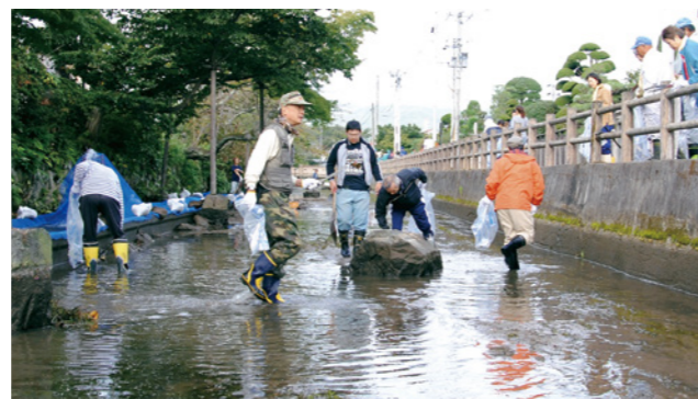
▲昨年度の沢端川清掃の様子

毎年、春と秋の川干に合わせ、白石市観光協会と白石商工会議所の共催でボランティアを募り、沢端川の清掃奉仕作業を行っています。残念ながら毎回、沢山の空き缶やペットボトル、ゴミなどが回収されます。キレイな沢端川をつくるためには皆さんの力が必要です。美しい城下町「白石」を守るため、川干清掃へのご協力をお願いします! 【服装・持ち物】 ①汚れても良い服装で、長靴を履いてお越しください。 ②火ばさみのある方はご持参願います。 ③軍手とゴミ袋は主催者側で用意します。