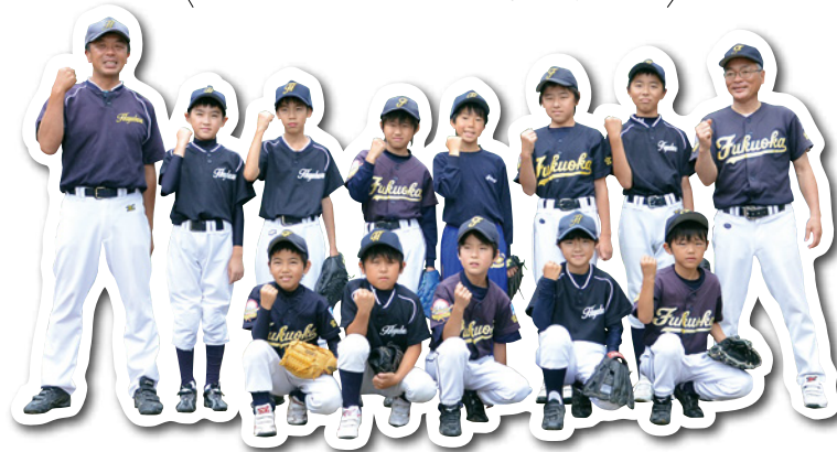
▲福岡少年野球クラブとハヤブサクラブスポーツ少年団の皆さん