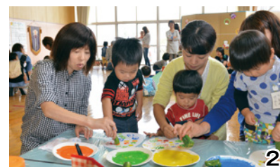
1・2 昨年のあいあいらんどin大平「夏祭」。スイカ割りや野菜スタンプで楽しみました