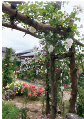
▲手作りのアーチが見事！