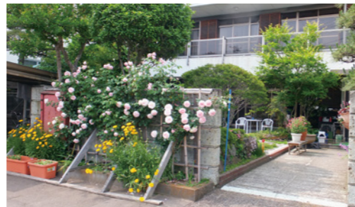
▲バラが皆さんをお出迎えます