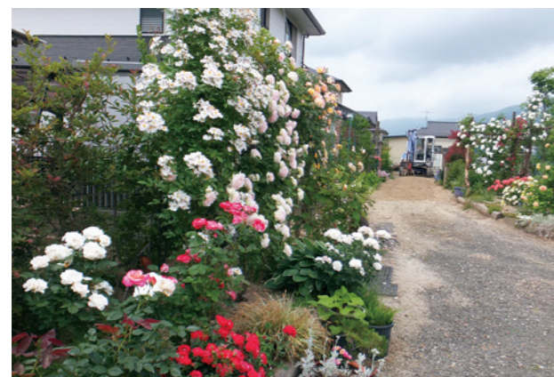
▲たくさんの種類のバラが楽しめます