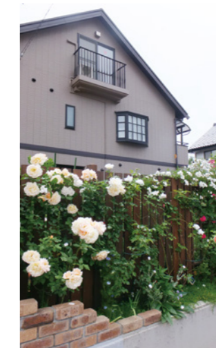
▲バラが木塀からあふれ出します