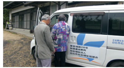
◎白石市社会福祉協議会 ☎22-5210