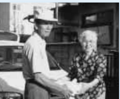
「こんにちは、お弁当持ってきたよ。」温かいままのお弁当が届けられました。

夕食はシルバー人材センターの会員によって届けられます。その際には、お年寄りへの声掛けや安否の確認も行われています。