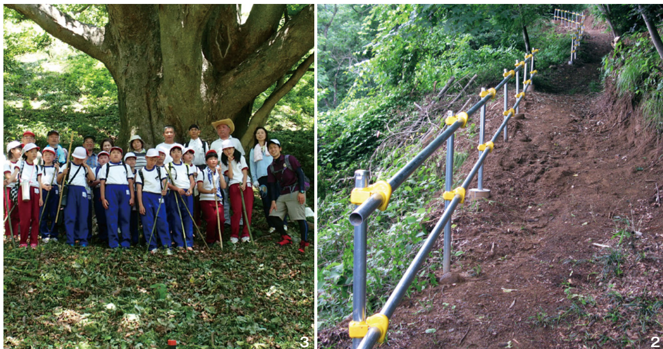
1_宮城県指定天然記念物に指定されている雄大な姿の逆さケヤキ 2_まちづくり交付金を活用し、遊歩道の補修と手すりを設置。安全に通れるようになりました 3_逆さケヤキは大平小学校の遠足コースとなっています