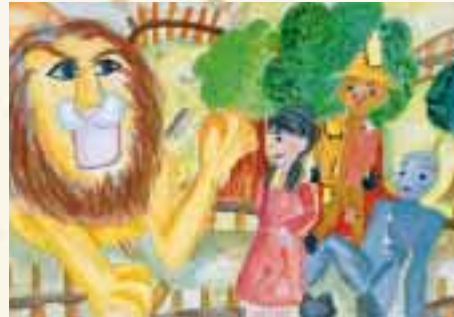
「オズのまほう使い」