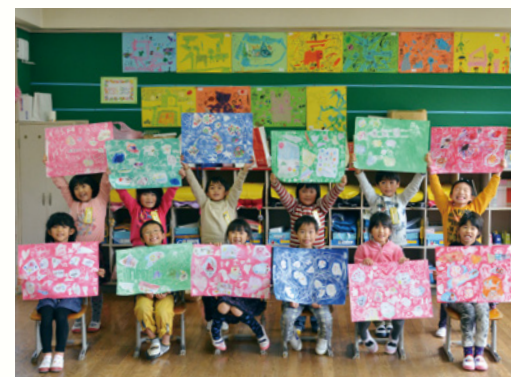
白川小学校1年生の皆さん