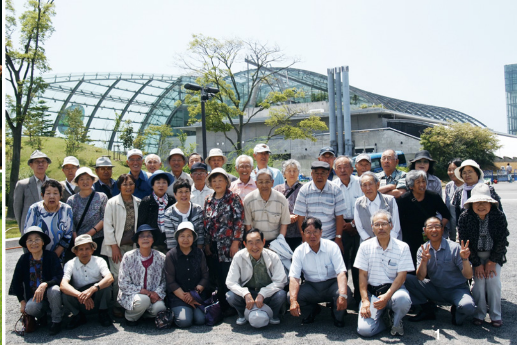
1_老人クラブ連合会研修旅行で記念撮影(平成26年6月18・19日) 2_仲間と交流を深めた老人クラブ女性のつどい(平成26年7月17日) 3_シニアスポーツ大会。グラウンドゴルフなどで汗を流しました(平成26年9月4日)