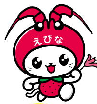
海老名市イメージキャラクター「えび〜にゃ」