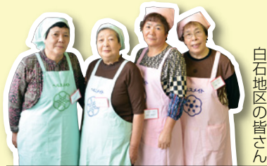
白石地区の皆さん