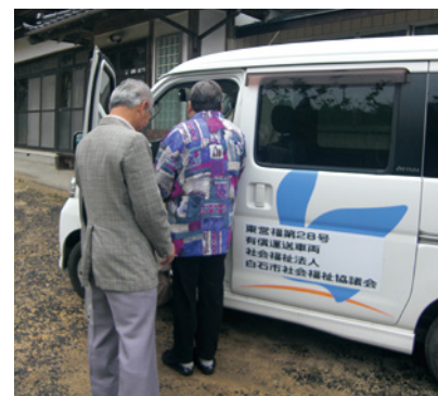
◎白石市社会福祉協議会 ☎22-5210