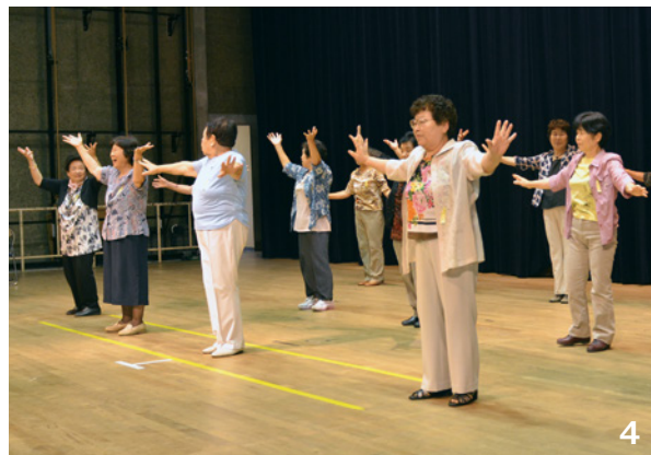
4_参加者全員で「いきいきクラブ体操」(平成26年7月17日)

おおむね60歳以上の方なら、どなたでも入会することができます。詳しくは、お住まいの地区の老人クラブ会長までご連絡ください。年齢を重ねても新しいことにチャレンジすることで、生き方は全く変わってきます。新しい出会い、たくさんの人々とのふれあいを深め、生きがいづくり・夢づくりをしてみませんか!