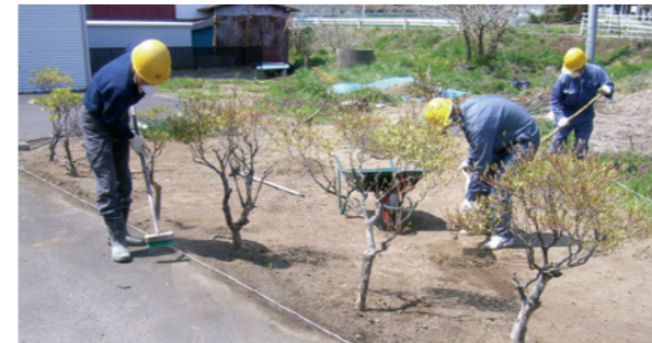
☎放射能対策室（旧勤労青少年ホーム内） ☎25-3720

除染例1 面的な除染： 宅地内の庭の堆積物を除去し除草を実施。同地内での地上1mの平均空間放射線量（毎時マイクロシーベルト）は0.24から0.18まで低減しました。