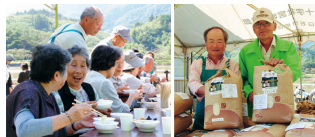
▲9月28日に「斎川米 新米まつり（収穫祭）」を開催。多くの人たちでにぎわいました。

●場所 国道4号沿い馬牛沼付近 ◎馬牛沼産直センター ☎25-0520 bagyunuma@yahoo.co.jp