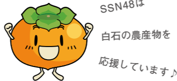
SSN48は白石の農産物を応援しています。

平成26年度白石市産「新米」取り扱い中！「馬牛沼産直センター」、「小十郎の郷」、「羽山朝採り市」で白石産新米を取り扱っています！詳しくは、各直売所へお問い合わせください。