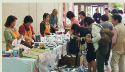
▲昨年の県庁1階展示販売会の様子

9月14日(日)の「第28回しろいし蔵王高原マラソン大会」(場所:南蔵王野営場)にも出店予定です。