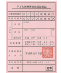
中学生まで(入院・通院兼用)