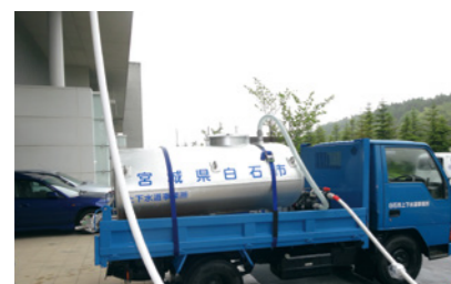
▲加圧式給水タンクによる応急給水

当日は、上下水道に関する相談コーナーも開設しますので、ぜひご相談ください。ご来場をお待ちしています。