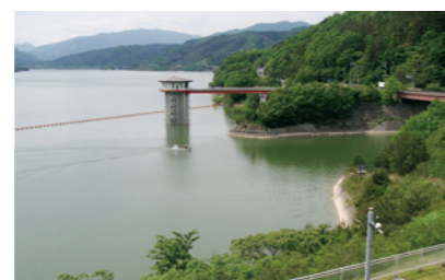
▲七ヶ宿ダムの取水棟