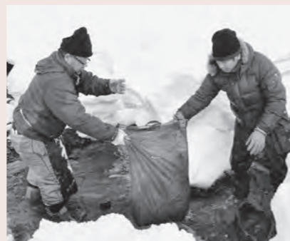
▲気温マイナス2.5度の中、作業する参加者の皆さん

の清流に浸しました。冷たい清流に浸すことでそばのアクが抜け、ほのかな甘みが増し、つるりとした喉ごしが楽しめる「寒ざらしそば」。材木岩公園内の「小原なごみ茶屋」などで3月19日(水)から提供されるほか、市外の飲食店でも提供される予定です。