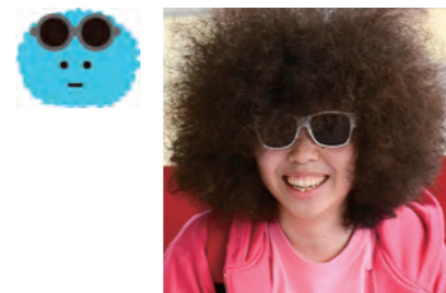
リュックサック今井