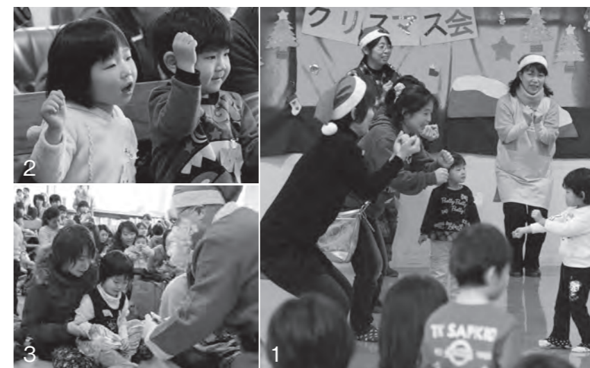
1・2_歌に合わせて踊りを楽しむ子どもたち 3_サンタさんからのプレゼントはボランティアの皆さんが一つ一つ心を込めて手作りしました