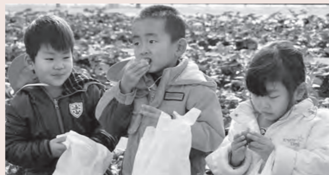
▲おいしそうにいちごをほお張る越河保育園の園児たち

この催しは、食農教育の一環として毎年開催。参加した園児たちは、「こんなに赤くて大きいいちご見たことない」「あま〜い」と、真っ赤に大きく実ったいちごを次々とほお張っていました。