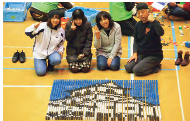
▲ドミノを並べ笑顔の参加者

11月23日、24日の両日、公益社団法人白石青年会議所主催の「白石ドミノ大会」が中央公民館で行われました。この催しは、共同作業を通じて市民の絆を強めようと、同会議所が企画。市民を中心に4人1組で10チームが参加し、ドミノ牌約6万5千個を並べ、「絆」「WE LOVE 白石」という字や、白石城など地域の名所を描いた絵柄などを2日間かけて仕上げました。参加者は途中でドミノを倒してしまったり、立て直したりと、根気よくドミノを並べ、最後にドミノ倒しが始まり、すべての絵柄が倒れると会場から大きな歓声が沸きました。