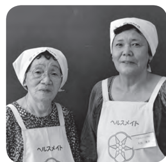
ヘルスマイト白石 白石地区の皆さん

作り方 ①キャベツ、タマネギ、セロリは1cm角に切る。鍋にサラダ油を熱し、中火で①を炒める。②がしんなりしたら、大豆を加えて炒め、軽くつぶしたトマト缶と(A)を入れる。2〜3分煮て、塩、コショウで味を調える。盛り付けてパセリを散らす。