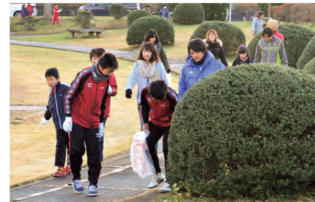
▲丁寧にゴミを探し清掃活動を行う参加者

12月1日、「第23回白石市スポーツ少年団奉仕活動」が白石川緑地公園で行われました。この活動は、普段使用している白石川緑地公園の美化活動に取り組むことで、公共心と郷土愛を育て、子どもたちの健全育成を図ることを目的に毎年開催されています。今年も野球、サッカー、空手、剣道、柔道、ソフトテニス、バレーボールのスポーツ少年団16団体から団員や保護者など約300人が参加。参加した子どもたちは、「いつも使っている公園がきれいになって良かったです」「ごみを捨てない人が増えたらいいな」と話してくれました。