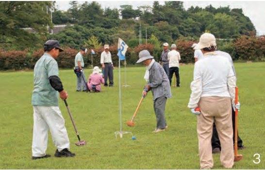
1_連合会研修旅行 (平成25年6月19日) 2_老人クラブ女性のつどい (平成25年7月19日) 3_シニアスポーツ大会 (平成25年9月6日)