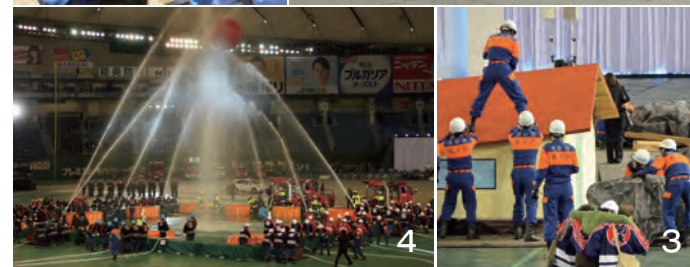
1_内閣総理大臣から表彰を受けた白石市消防団長たちが、風間市長、勝又良白石消防署長(前列右から4番目)と記念撮影 2_平成25年6月9日に行われた白石市総合防災訓練で、救助訓練を行う地域住民と小原分団員たち 3・4_平成25年11月25日に行われた記念大会に全国から集結した消防団の代表者たち。大地震発生を想定した救助演技や放水演技を披露

11月25日、東京ドーム(東京都)で開催された「消防団120年・自治体消防65周年記念大会」の席上で、白石市消防団が内閣総理大臣から表彰されました。この催しは、東日本大震災での消防団の功績を称えとともに、震災の記憶や教訓を後世に伝え、復興・復興への決意を新たにすることが目的。この日は、全国の消防団員や婦人防火クラブなどの代表者約37,000人が集結し、宮城、岩手両県の12の消防団が表彰された後、消防実演で放水演技や救助演技などが行われました。 12月9日には、跡部敏団長と高橋鉄夫副団長、阿