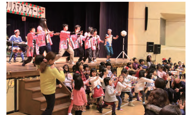
▲「うーめん体操」は大人気！

「うーめん体操」の動画再生件数もうすぐ8万回！うーめんの魅力がさらに広がっています。