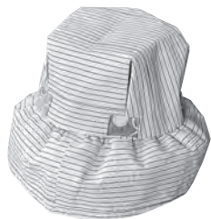
▲古着や布切れ端をリサイクルした「ぼうし」

1月の休館日 1～3・6・14・20・27日 ☎22-1635 ☎22-1636