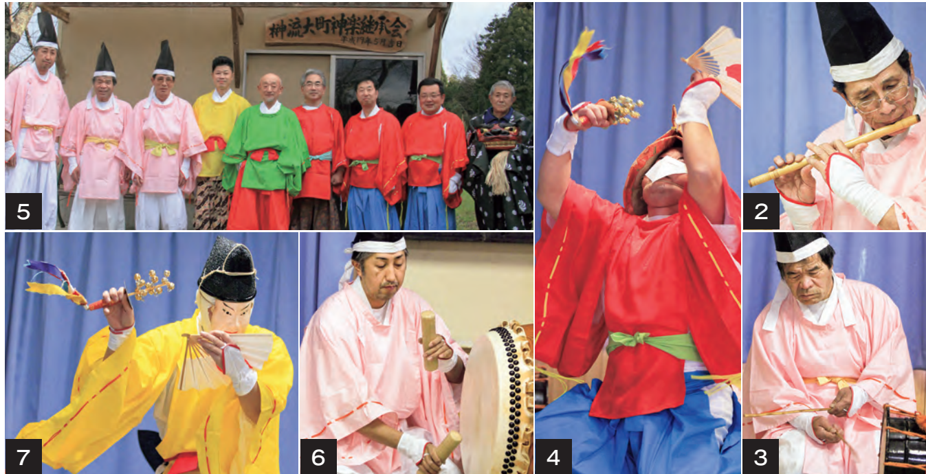
1～7_平成25年12月8日、まちづくり交付金を活用し購入した真新しい神楽装束を身にまとい、伊邪那岐命と伊邪那美命が天神の命令で日本の国土を作った時の様子を表した「四方堅ノ舞」と、保食命が日本で初めて稲の種子を蒔き、農業を日本に広めようとした時の様子を表した「種播ノ舞」などの練習に励む保存会の皆さん。同会は1月5日、碧水園で午前9時30分から行われる「舞台びらき」にも出演されます。