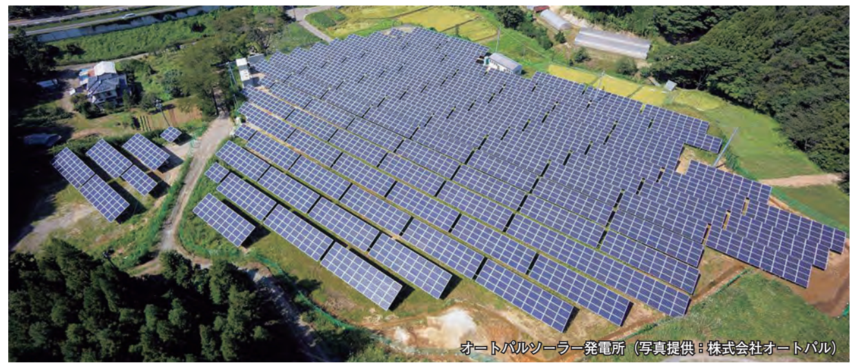
オートパルソーラー発電所

平成25年11月25日、仙南地域で初という「オートパルソーラー発電所」が完成し、旧南中学校跡地で運転開始式が行われました。