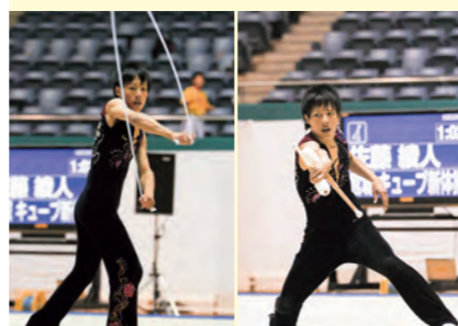
ロープ 種目別2位入賞 クラブ 種目別2位入賞