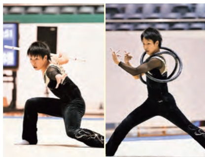
スティック 種目別13位 リング 種目別4位入賞