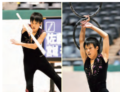
スティック 種目別3位入賞 リング 種目別2位入賞