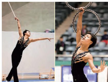
スティック 種目別9位 リング 種目別11位