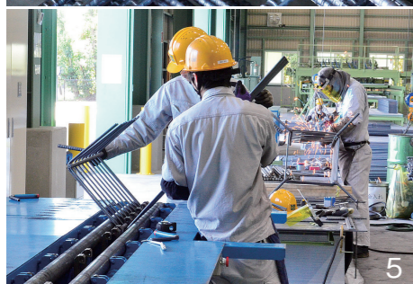
1_メークス株式会社東北工場の外観 2_製品・資材の保存スペースと、鉄筋加工スペースがある内観 3_9月28日、完成した東北工場を見学する関係者たち 4_ユニット鉄筋。現場加工しなければならない従来の基礎鉄筋とは異なり、工場で作成したため、現場での施工が容易 5_ユニット鉄筋を用途やサイズに合わせて加工する作業。写真手前は、鉄筋を平行に並べて折り曲げて加工する作業で、写真奥は、溶接加工作業の様子