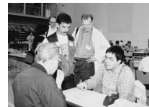
将棋でも市民と交流 (外国選手の中には、将棋も得意とする方がいて交流が深められました。)

▶こけしの給付け体験 (顔が出来上がると思わずニッコリ。囲碁対局とは違った表情を見せていました。)