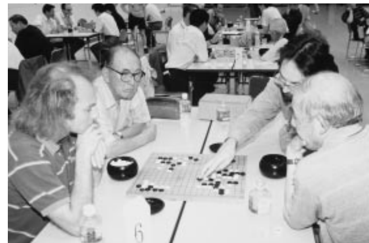
◀囲碁交流大会 (外国選手と市民がペアになっての対局は、熱戦が繰り広げられました。)

「世界アマチュア囲碁選手権戦」の出場者を招いて六月二十四日、ホワイトキューブで、白石囲碁国際交流大会が開催され、囲碁を通じて市民との交流が行われました。 白石市を訪れたのは、世界アマチュア囲碁選手権戦に参加した選手や招待委員など、二十四カ国から三十七人です。 囲碁交流大会は、外国選手と白石囲碁同好会会員などの市民がペアになって、対局が行われました。また、一行は対局前に、白石城や武家屋敷、材木岩などを見学したり、碧水園で日本舞踊や琴などの鑑賞と茶道体験、そしてキューブではこけしの給付けにも挑戦し、白石の伝統・文化に浸りました。