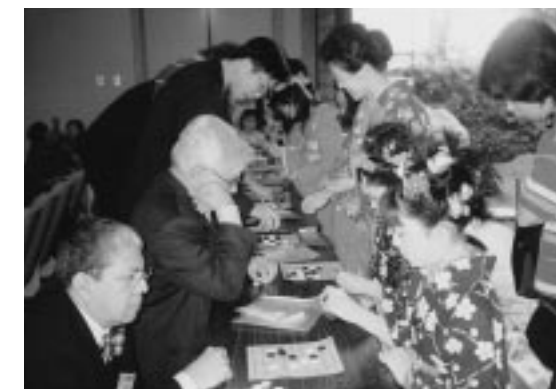
囲碁指導 (碧水園で日本舞踊、琴などを鑑賞した外国選手は、お礼に囲碁の指導を行いました。)